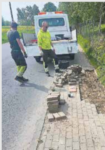
W maju zlikwidowano nierówności nawierzchni chodnika przy ul. Kosińskiego w Targowej Górze