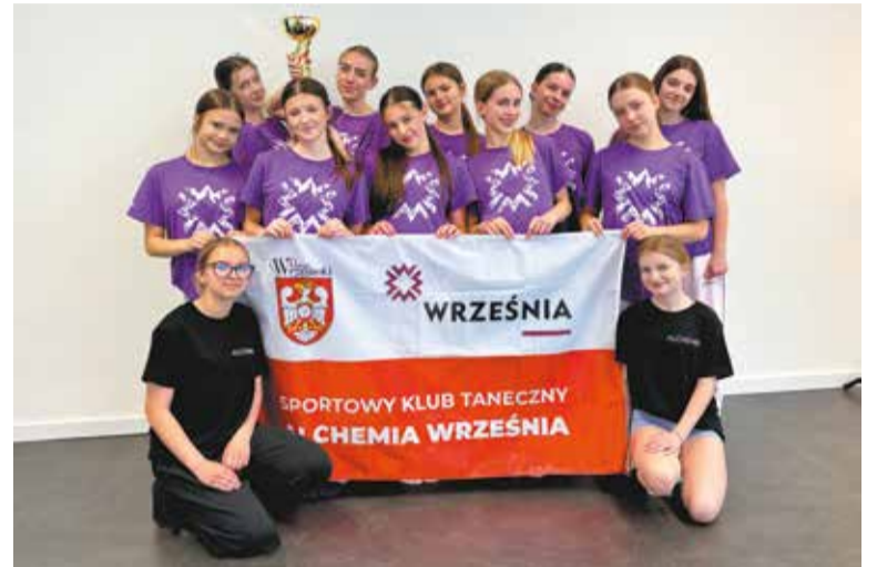
Wiele wyzwań, wiele osiągnięć