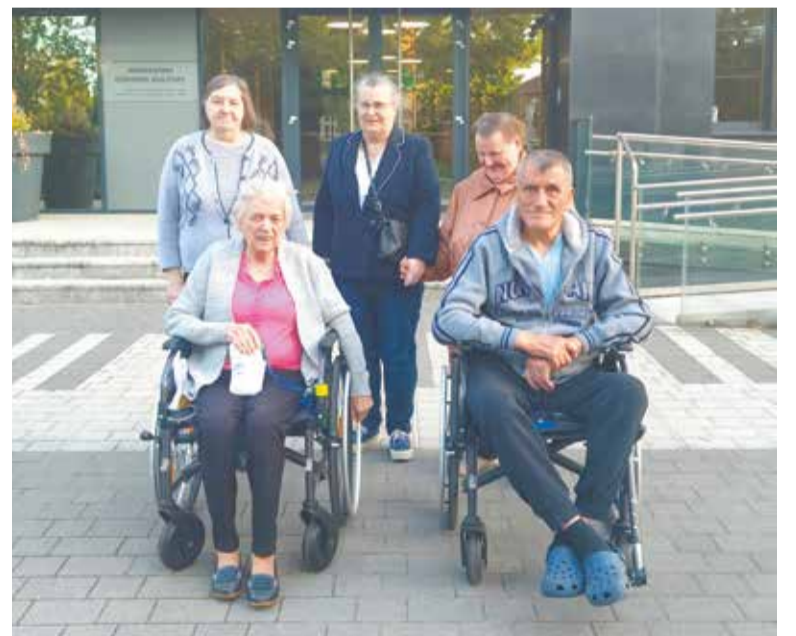
Każdy wyjazd daje mieszkańcom wiele radości