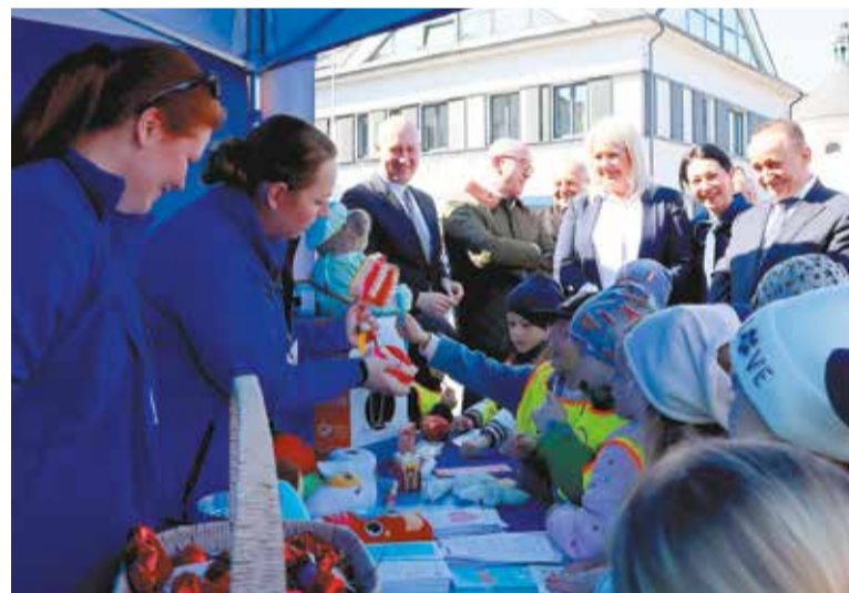
Nie zabrakło atrakcji dla najmłodszych