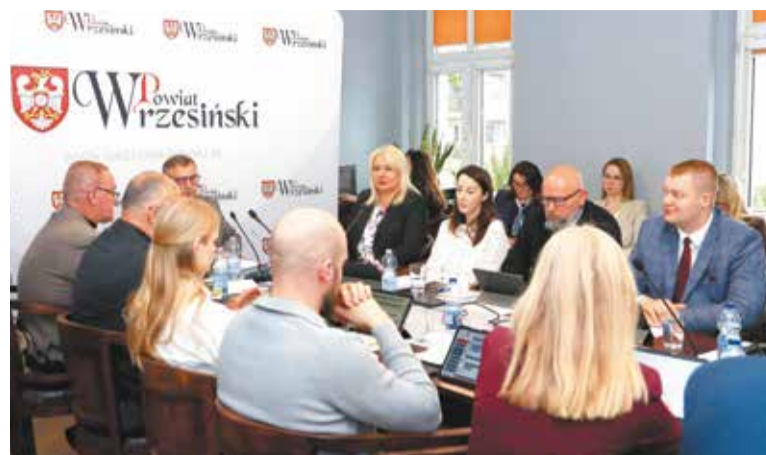
Posiedzenie odbyło się w pełnym składzie Rady

Kontynuowane są także działania związane z ochroną środowiska, w tym programy usuwania azbestu na terenie powiatu. W obszarze kultury wprowadzono środki pozyskane przez Powiat w ramach programu „Kultura w drodze”, dzięki którym odbędzie się koncert orkiestry Amadeus.