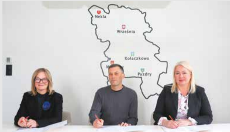
Zawarcie umów na przygotowanie projektów rozbudowy drogi Lipie-Krzywa Góra oraz przebudowy drogi Borzykowo-Gorazdowo