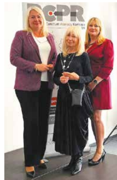
Zdjęcie z Anną Marią Wesołowską

W swojej działalności edukacyjnej Anna Maria Wesołowska często podkreśla, że „dzieci bardziej obserwują, kim jesteśmy, niż słuchają tego, co mówimy”. To właśnie dom, szkoła i najbliższe otoczenie tworzą fundament bezpieczeństwa młodego człowieka. Tam kształtuje się poczucie własnej wartości, empatia i umiejętność budowania relacji bez przemocy.