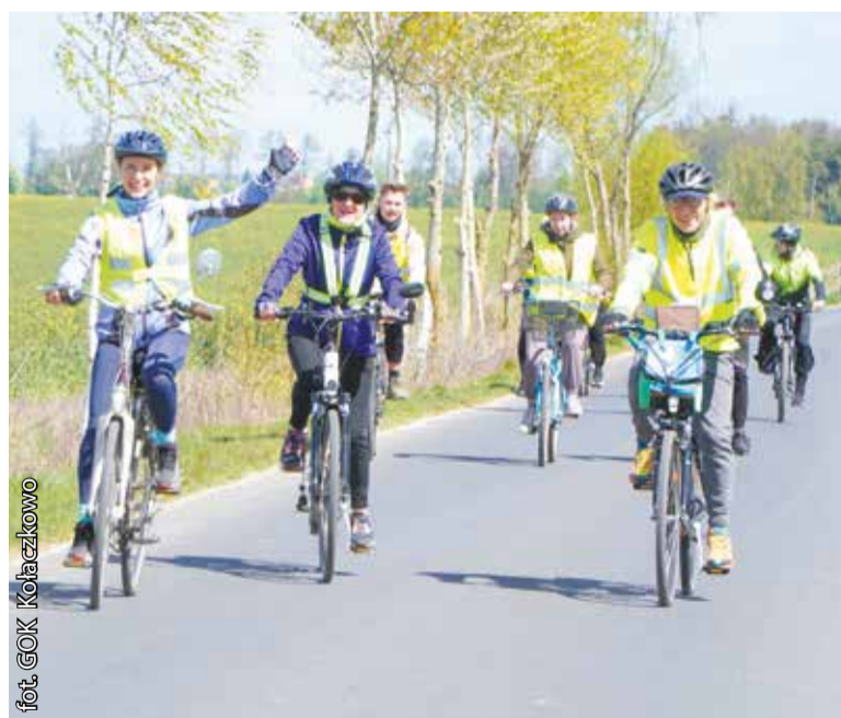
Uczestnicy pokonali nową trasę, która wiodła m.in. przez Ciesle Małe

Wiatr i słońce towarzyszyły uczestnikom 16. Rajdu Rowerem po Książkę. Już tradycyjnie stanowił on inaugurację sezonu na dwóch kółkach w powiecie wrzesińskim.