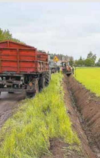
Odmulanie rowów przydrożnych