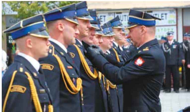
Moment wręczenia odznaczeń