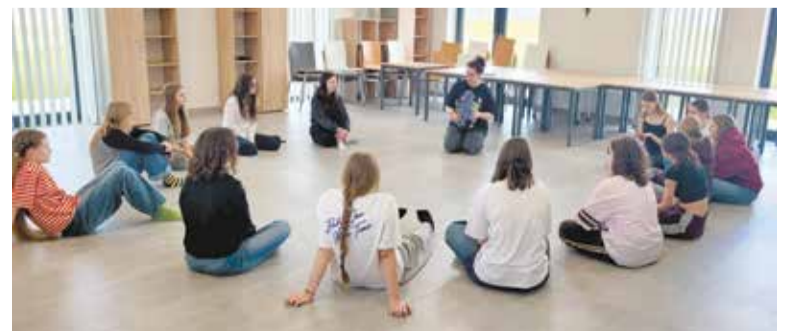
Zajęcia w bursie

W programie nie zabrakło również działań kreatywnych – uczniowie przygotowali własne etudy, czyli krótkie scenki teatralne, które zaprezentowali przed grupą. Praca twórcza rozwijała