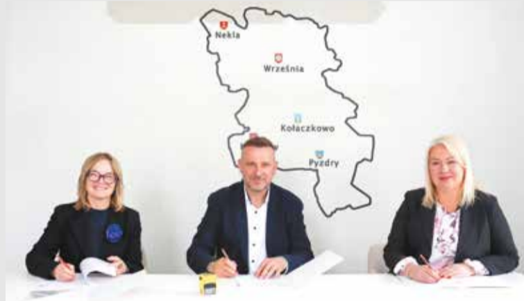
Podpisanie umowy na przebudowę drogi powiatowej Ksawerów-Pietrzyków