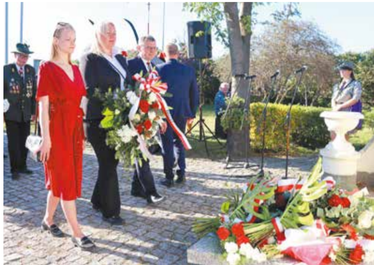
Delegacja powiatu w Sokołowie