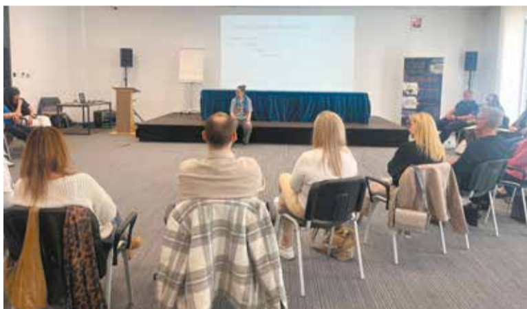
Rozmowa na ważne tematy