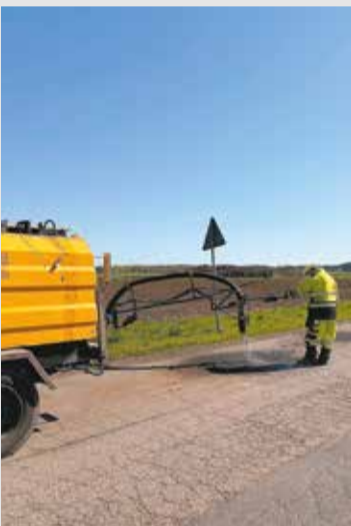
W kwietniu prowadzono remonty cząstkowe nawierzchni dróg powiatowych