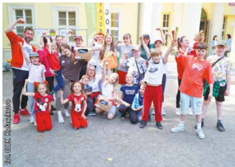
Biedronki zdominowały rajd. To 23-osobowa drużyna z Kołaczkowa