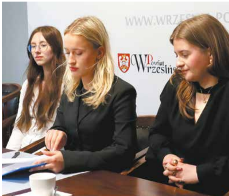
Podczas drugich obrad młodzieży