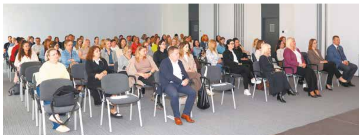
Liczni uczestnicy szkolenia