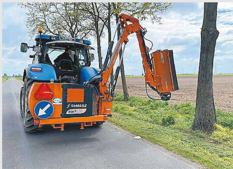
Mechaniczne wykaszanie poboczy na drogach zarządzanych przez powiat