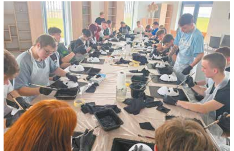
Młodzież podczas warsztatów

W trakcie wyjazdu uczestnicy odwiedzili również Centrum Badań i Rozwoju Nowoczesnych Technologii w Grzymysławicach. Zapoznali się tam z możliwościami zaawansowanego technologicznie sprzętu,