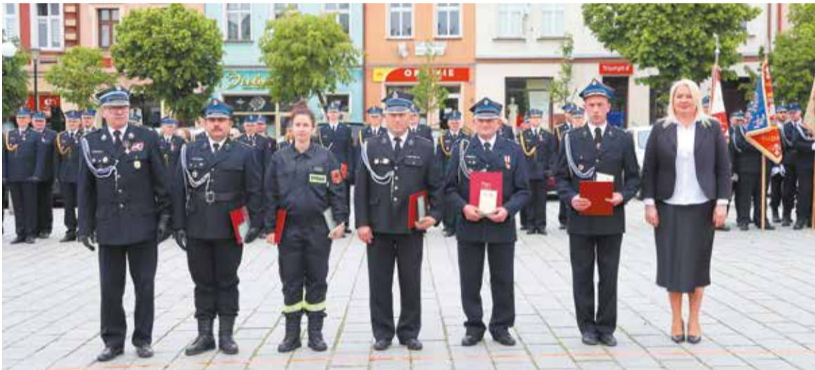
Wyróżnienia starosty trafiły m.in. do OSP