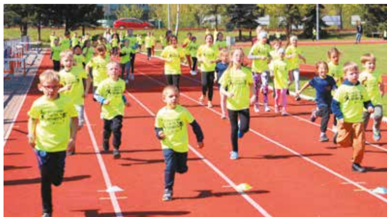
Tradycyjna rozgrzewka przed konkurencjami

które odbędą się kolejno: 28 czerwca w Nekli, 12 lipca w Kołaczku, 29 sierpnia w Pyzdrach oraz 5 września w Miłosławiu. Krzysztof Ciesielski