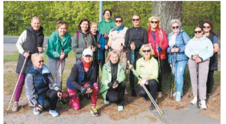
Uczestniczki zajęć nordic walking