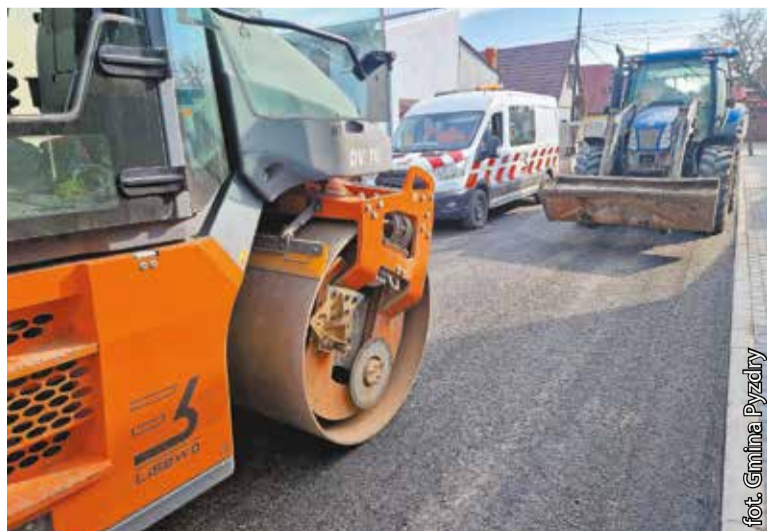
Ulica 11 Listopada