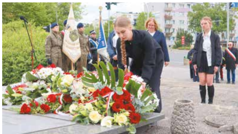
Młodzież pamięta o rocznicach

Po zakończeniu występu delegacje złożyły kwiaty pod pomnikiem. W imieniu władz powiatowych wiązanki złożyli: starosta wrzesiński