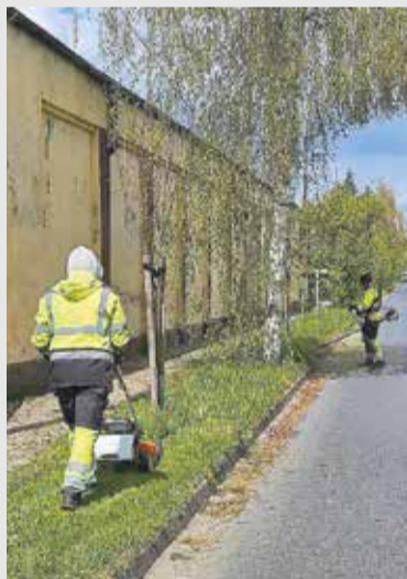
Prace związane z ręcznym wykaszaniem rowów i poboczy w ciągach dróg powiatowych