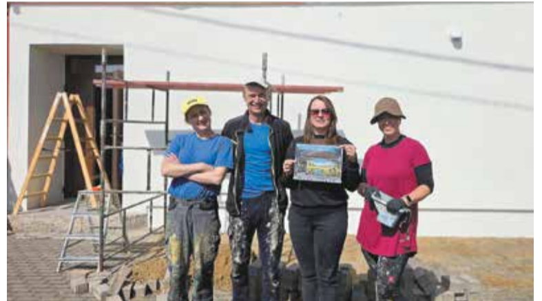
Prezentacja oczekiwanego rezultatu prac