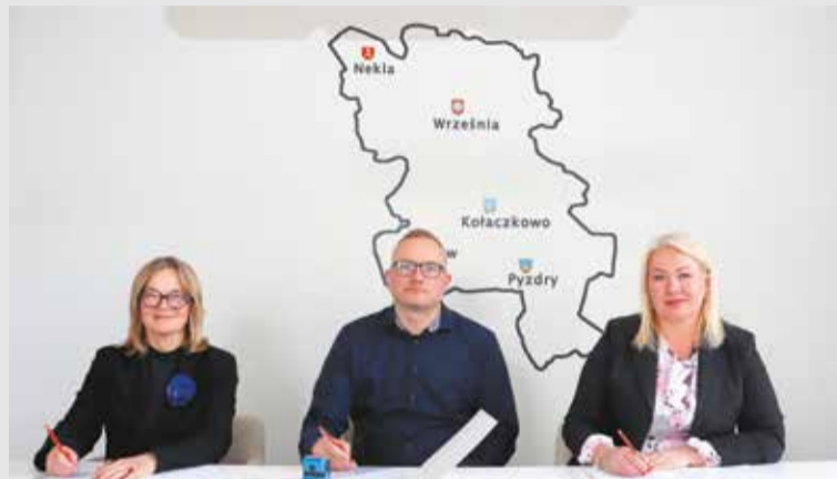
Zlecenie opracowania dokumentacji przebudowy drogi Czeszewo-Szczodrzejewo