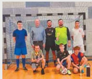
Zwycięska drużyna z Bugaju