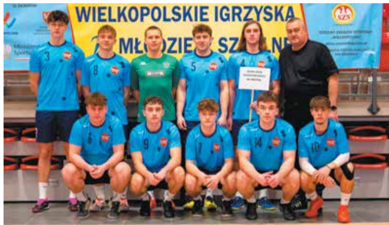
Młodzi futsalowcy z Wojska Polskiego