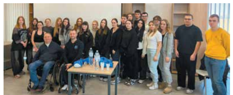
Młodzież chętnie uczestniczy w warsztatach

19 marca członkowie Szkolnego Klubu Wolontariatu oraz Samorządu Uczniowskiego z Zespołu Szkół Politechnicznych we Wrzesni wzięli udział w warsztatach edukacyjnych w Bursie Międzyszkolnej w Grzymysławicach poprowadzonych przez przedstawicieli Fundacji „Podaj Dalej” z Konina.