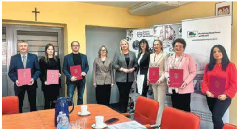
Inauguracja Powiatowej Rady Rynku Pracy