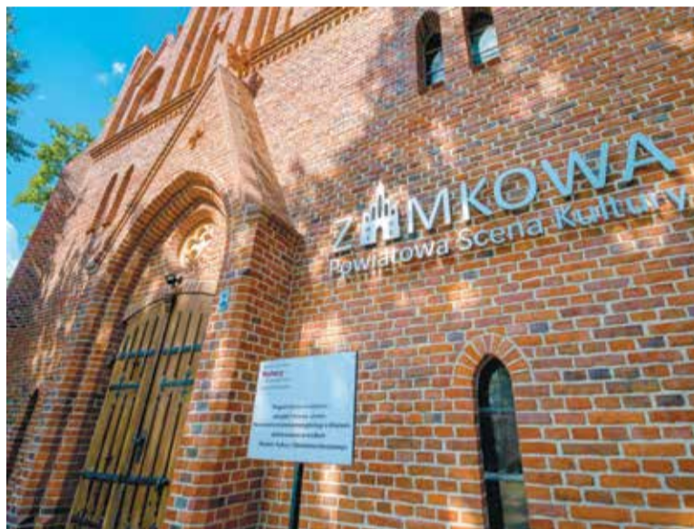
Artyści Teatru Wielkiego ponownie wystąpią w Miłosławiu

Druga pula środków, zostanie przeznaczona na zakup i posadzenie 70 lip drobnolistnych wzdłuż drogi powiatowej w Orzechowie. To działanie nie tylko upiększy krajobraz, ale także stworzy przyjazne środowisko dla owadów zapylających.