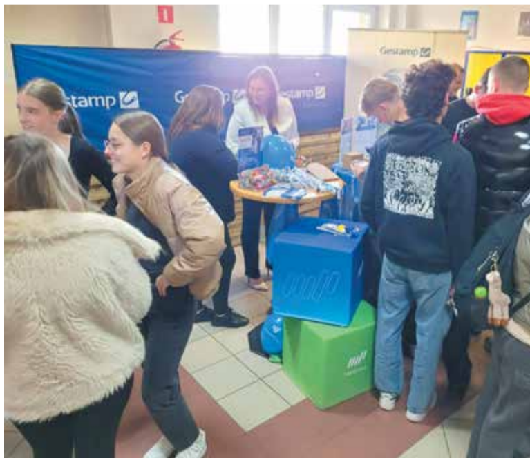
Młodzież chętnie zaglądała na stoiska pracodawców

Uczniowie mieli szansę porozmawiania o warunkach pracy, zarobkach, możliwościach rozwoju