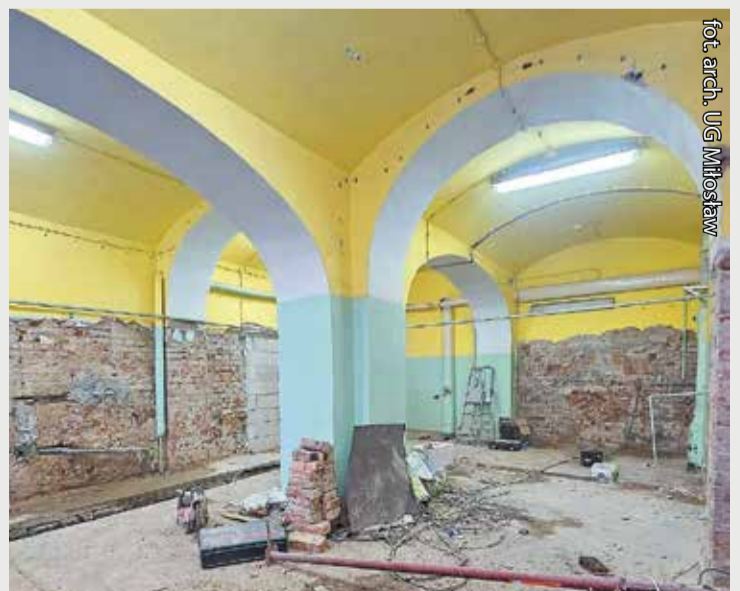
Wnętrze pałacu podczas remontu