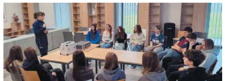
Licealiści dyskutowali o uzależnieniach

takie jak: konsekwencje prawne posiadania i rozpowszechniania narkotyków, wpływ substancji psychoaktywnych na organizm człowieka oraz konsekwencje społeczne uzależnień. To ważna lekcja, która pomoże młodym ludziom podejmować świadome i odpowiedzialne decyzje. Wydział Edukacji