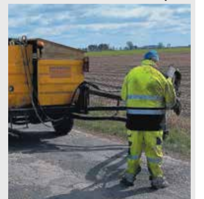
Remonty na drogach powiatowych