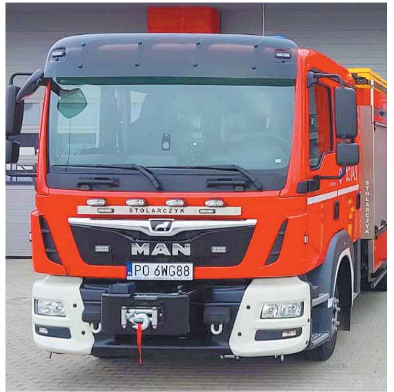
Nowy system usprawni wyjazdy do akcji

Obecnie system znajduje się w fazie testowej, a jego pełne wdrożenie planowane jest na początek maja 2025 roku. Co istotne, „e-Remiza” obejmie wszystkie jednostki Ochotniczej Straży Pożarnej w Krajowym Systemie Ratowniczo-Gaśniczym oraz te OSP, które posiadają pojazdy pożarnicze. Zwiększy to spójność i efektywność działań ratowniczych na terenie całego powiatu. (red.)