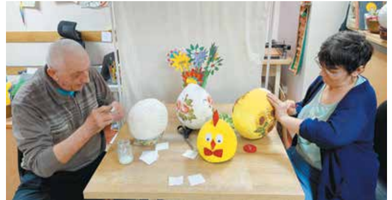
Tworzenie dekoracji w pracowni terapii zajęciowej

conki i sianiem rzeżuchy. Jak co roku, wykorzystując cieplejsze dni, mieszkańcy wraz z terapeutami i opiekunami upiększają ogród, wysadzając otrzymane na Dzień Kobiet prymulki. Z początkiem kwietnia gościliśmy także młode adeptki fryzjerstwa z Zespołu Szkół Zawodowych nr 2 we Wrzesni, które zadbały o uczesania mieszkańców. DPS