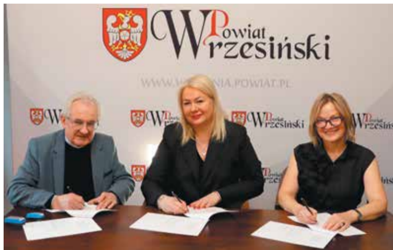
Moment podpisania umowy

Przyznane dotacje są istotnym wsparciem dla lokalnych wspólnot w dbałości o dziedzictwo kulturowe powiatu wrzesińskiego. Przeprowadzone prace konserwatorskie po-