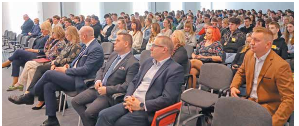
Konferencja zgromadziła młodzież z powiatowych szkół